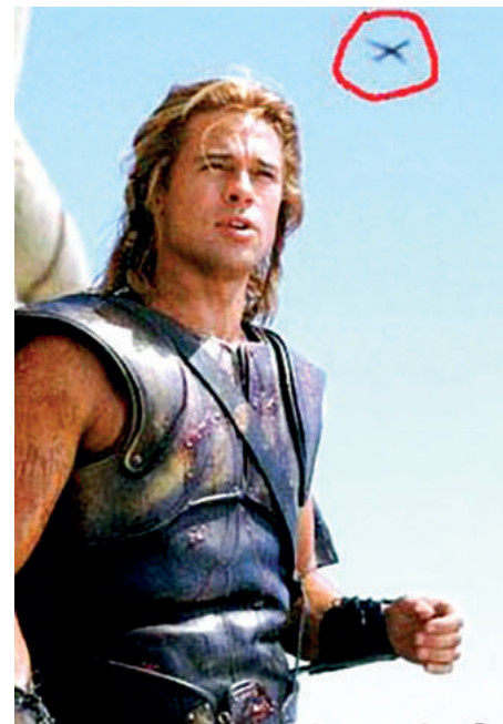
Brad Pitt'in oynadığı Tarihi Truva filminde gözden kaçan önemli bir ayrıntı

Sonuç olarak bakıldığında anakronizm, sinemacılar için kendini ifadenin dolaylı ve artistik bir yolu görülebileceği gibi özellikle baskıcı yönetimlerin olduğu dönemlerde dolaylı bir anlatım sanatı olarak önemli bir enstrüman olabilmektedir.