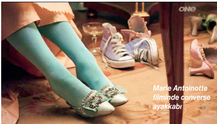
Marie Antoinette filminde converse ayakkabı

tanımlanırken, amaçlı yani hedef gözetilerek yapılan anakronizm biraz daha özel bir yere sahiptir.