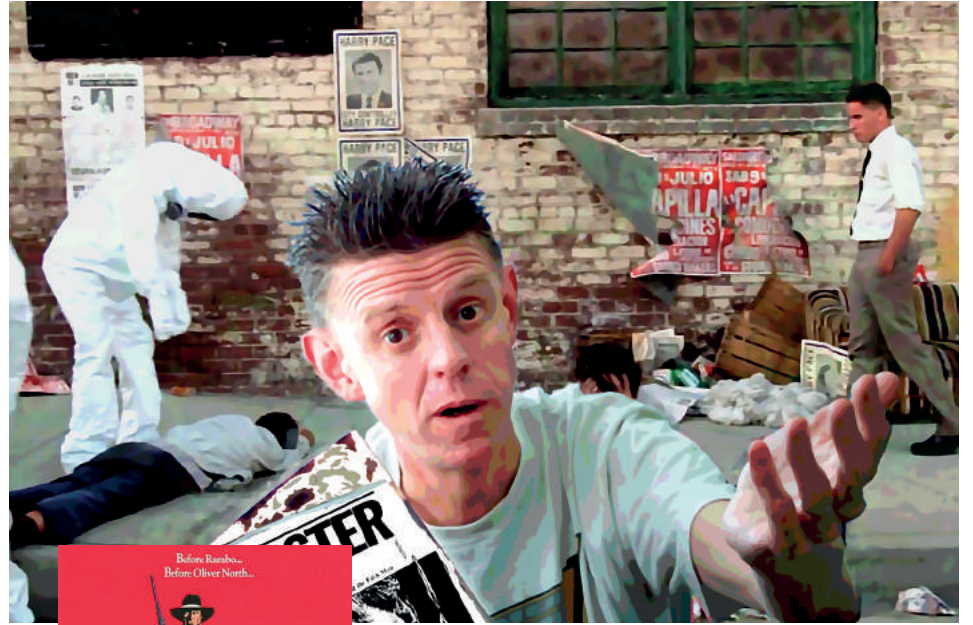
Alex Cox, Walker filmiyle Amerikan yönetiminin dış politikasına karşı tüm eleştirel bakışını yansıtmayı amaçlamıştı.

İşte burada imdada neredeyse olayların birebir